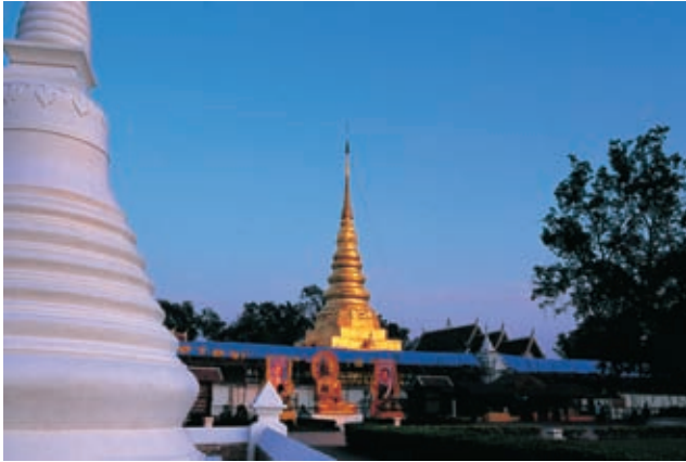
วัดพระบรมธาตุแช่แห้ง ตั้งอยู่บนเนินทางฝั่งตะวันออกของแม่น้ำน่าน Phraborommathat Chae Hang temple is located on the hillside in the east side of Nan River

อุโบสถ “พระธาตุขเวดากองจำลอง” สร้างสมัยพระเจ้าสุริยพงษ์ผริตเดชฯ โปรดให้สล่า (ช่าง) น้อยยอดคนเมืองลำพูนมาก่อสร้างเมื่อ พ.ศ. ๒๔๕๑ “พระวิหาร พุทธไสยยาสน์” สร้างเมื่อ พ.ศ. ๒๑๒๙ โดยนางเสด พลัวชยาของพระยาหน่อเสถียรไชยสงครามเมืองน่าน (พ.ศ. ๒๑๐๓-๒๑๓๔)