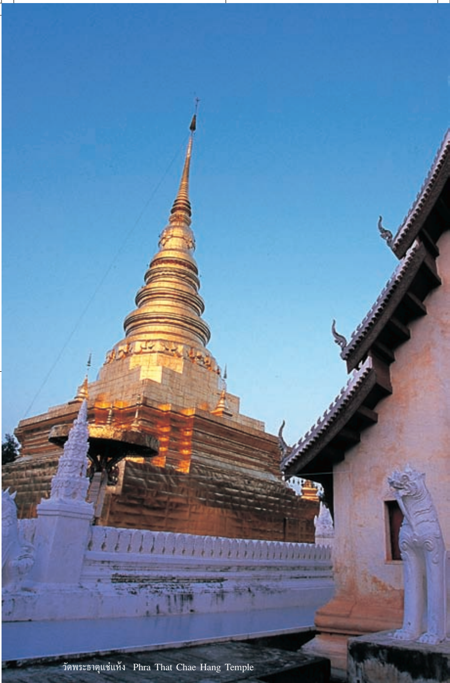
วัดพระธาตุแช่แห้ง Phra That Chae Hang Temple